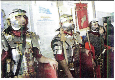
▲ LEGIONARIOS para atraer turismo arqueológico.

Del 17 al 20 de noviembre pasado se celebró en Paestum (Italia) la octava Muestra Mediterránea de Turismo Arqueológico. Un encuentro internacional promovido por la provincia de Salerno, en la Campania napolitana, que tuvo como objetivo debatir los problemas de la difusión y la conservación del patrimonio cultural del Mediterráneo. Junto al fabuloso templo griego de Neptuno, arqueólogos, historiadores, responsables de administraciones públicas, profesionales del turismo y de la información de ambas riberas del Mare Nostrum intercambiaron sus experiencias y acordaron desarrollar nuevos proyectos de colaboración transnacional. La revista CLÍO fue el único medio de comunicación español que participó en el evento.